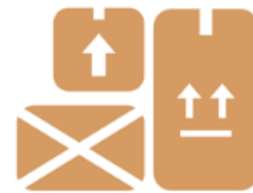
Оборудование и техника